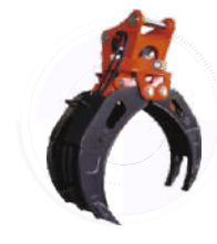
Захват для брёвен

ЭКСКЛЮЗИВНЫЙ ДИСТРИБЬЮТОР ТЕХНИКИ WENEAVY В РОССИИ КОМПАНИЯ ООО ТЕХЦЕНТР «ГРАНД Т» Адрес: Россия, г. Владимир, ул. Тракторная, 33 Сайт: weheavy.ru E-mail: info@weheavy.ru